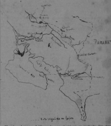
Muestra el mapa el itinerario que siguió en su reciente gira por la región sur del país el secretario de educación pública...

COMPLETO EL RECORRIDO DE TODA LA REGION SUR DEL PAIS, EN SU ÚLTIMA JIPA, EL SECRETARIO DE EDUCACION PUBLICA